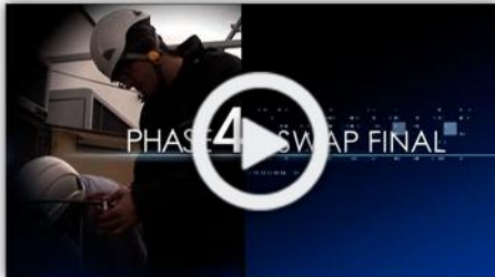
Démo du Tutoriel pour l'entreprise Ericsson