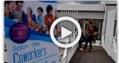
Péniche Touta Paris 350 personnes Mai 2016