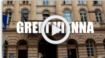
Evènementiel International Global real estate and economy talks Vienne Autriche Mai 2016